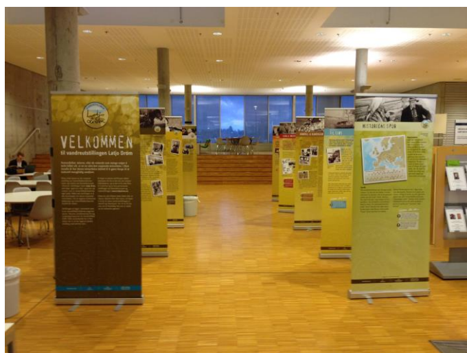
Vandreutstillingen Latjo Drom i HiØs bibliotek

Biblioteket på HiØ var positive til både å vise fram Glomdalsmuseets vandreutstilling og lage en egen bokutstilling med litteratur om nasjonale minoriteter og de reisende. Dette tiltaket var ment å fungere som en mulighet for etterarbeid for studentene fra prosjektet, men også gi informasjon til andre studenter og lærere om temaet.