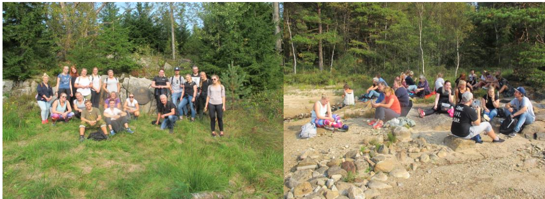
Studentene ved minnesmerket på Snarsmoen og ved rasteplassen på tilbakeveien

Denne turen var et eksempel på hvordan lokalområdets kulturminner kan brukes som en konkretisering av mer teoretiske tilnærminger til et tema, og samtidig bidra til å motivere studenter for å tilegne seg mer kunnskap. Som tidligere nevnt kan dette også løses på flere måter, for eksempel ved å samle studenter og representanter fra en nasjonal minoritet om ulike kulturaktiviteter knyttet til dramatisering, fortellinger, musikk eller håndverkstradisjoner.