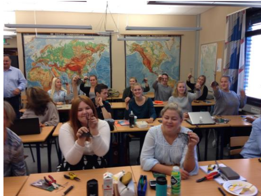
Konsentrasjon, nøyaktig arbeid og god instruksjon førte til et godt resultat!

Erfaringen fra denne dagen var at studentene fikk en grundig gjennomgang av de viktigste siden ved de reisendes historie, overgrepene fra storsamfunnet i tidligere tider, men også positive sider ved livet og kulturen, blant annet samholdet i familiene, yrkesutøvelsen i håndverks- og handelstradisjoner og om de reisendes historie som en del av Norges historie og et uttrykk for mangfoldet i det norske samfunnet i dag.